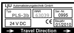
Typenschild mit WNR

Bei einer Ersatzteilbestellung geben Sie die Werk-Nummer WNR der Komponente an und richten diese an die auf der Innenseite des Deckblatts (Seite 2) angegebene Adresse. Die Werk-Nummer finden Sie auf dem Typenschild der einzelnen Komponenten. (siehe Abbildung)